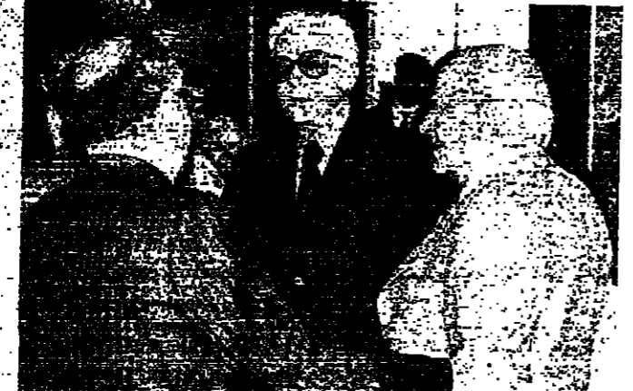
الرئيس شمعون يتبادل التحية مع الرئيس صائب سلام في قصر الجمهوري

وقال وزير الاقتصاد والتجارة السيد عباس وزير «الأناور» أمس: إن الوضع الوزاري وما يتردد عن اتصالات تجري بين مختلف الأطراف للاتفاق على العمل قبل أن يتقرر منح استقالة الحكومة. وأضاف: إن اقتناع الوزراء بضرورة المساهمة في التهدئة وعدم إثارة ما من شأنه أن يعجل في تغير الوضع الوزاري، قبل عطلة العيد، وإفساح المجال أمام رئيس الجمهورية لتخاذ القرار المناسب في الوقت المناسب.